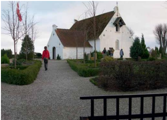
I tidens løb har mange takket klokken på Alrø for deres liv. Når tågen overraskede folk på isen – eller i båd – gelejdede aftenringningen de vildfåre i retning mod land.